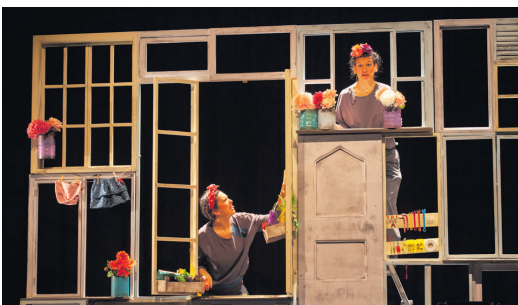
Funció de 'Sopa de pedres' a LaSala

La companyia sabadellenca Engruna Teatre ha guanyat el Premi Xarxa Alcover de la Mostra d'Igualada.