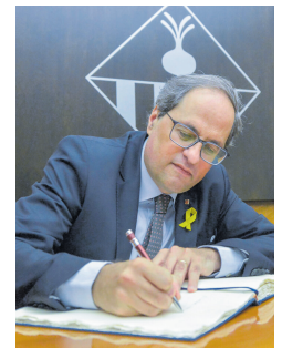
Antiga visita oficial de Quim Torra a Sabadell

Torra parlarà des de l'experiència política i el coneixement personal dels principals actors polítics de l'anterior legislatura.