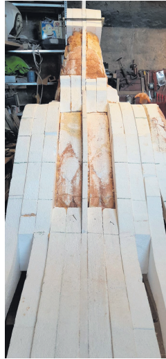
A l'esquerra, l'àliga coberta amb tela. A la dreta, l'estructura